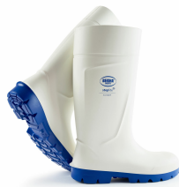
wit - blauw