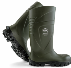
groen - zwart